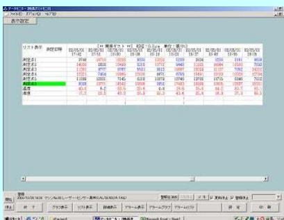
清浄度グラフ表示