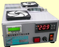
二酸化塩素ガス発生装置