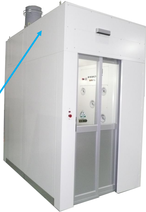
2連式エアシャワー